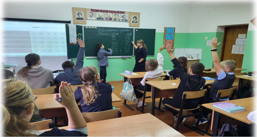
Игра «Угадай профессию»