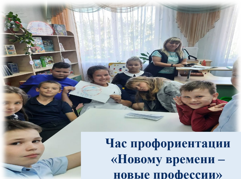
Час профориентации «Новому времени – новые профессии»