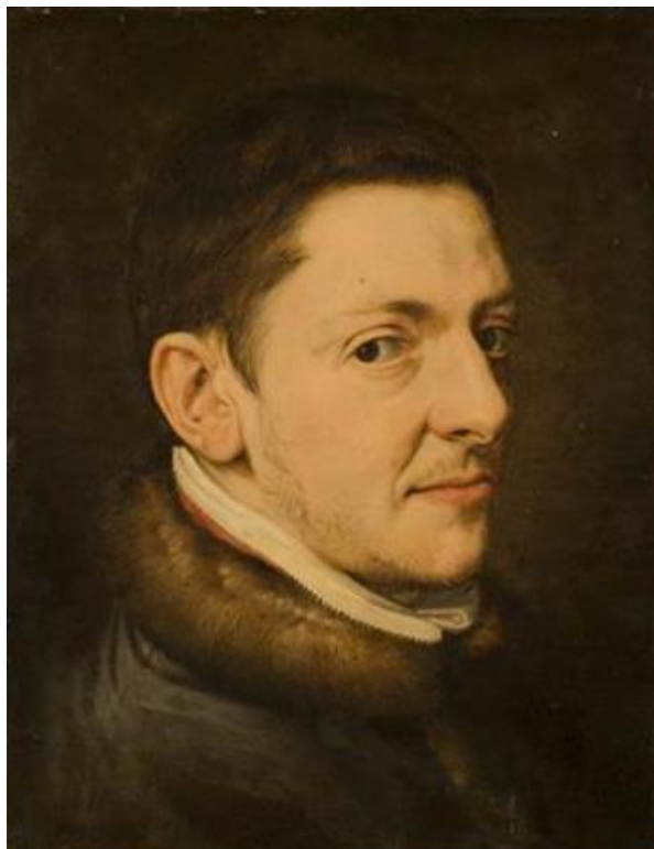
Рис. 2. Неизвестный художник немецкой школы XIX в. Антон Павлович Лосенко. Бумага на холсте, масло, 39×30 см.

А.П. Лосенко (1737-1773) (Рис. 2) был отличным мастером композиции, при работе над картиной, он учил придерживаться принципа целесообразности.