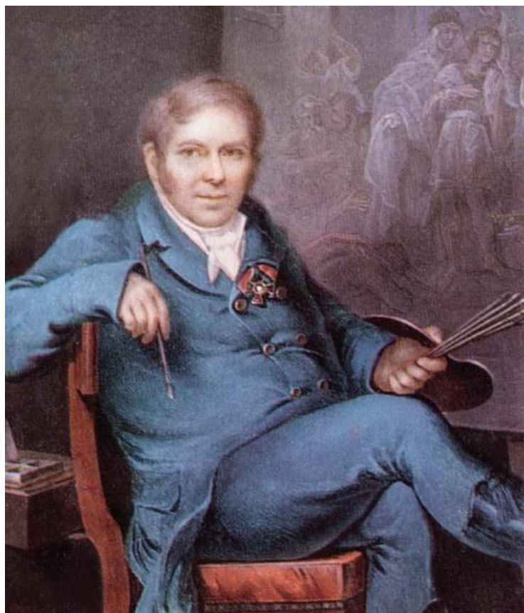
Рис. 3. Головачевский А.К. Портрет Григория Ивановича Угрюмова. Холст, масло 51x39,3 см. Государственный Русский музей.

Особо стоит отметить большого мастера исторического жанра и отличного педагога – Г. И. Угрюмова, который также искал пути совершенствования обучения основам композиции (Рис. 3).