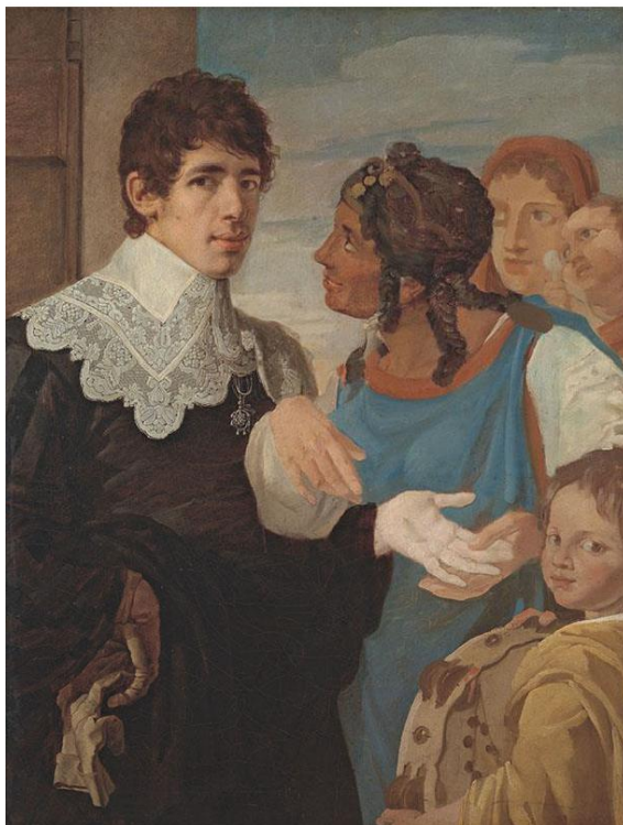
Рис. 4. Шебуев В.К. Гадание. Автопортрет. 1805-1807, холст, масло, 73х91 см. Третьяковская галерея, г. Москва

Одним из лучших учеников Г.И. Угрюмова был В. К. Шебуев (1777—1855) (Рис. 4). Он стремился приблизить учеников к познанию природы, окружающего мира, к познанию его объективных законов строения и форм.