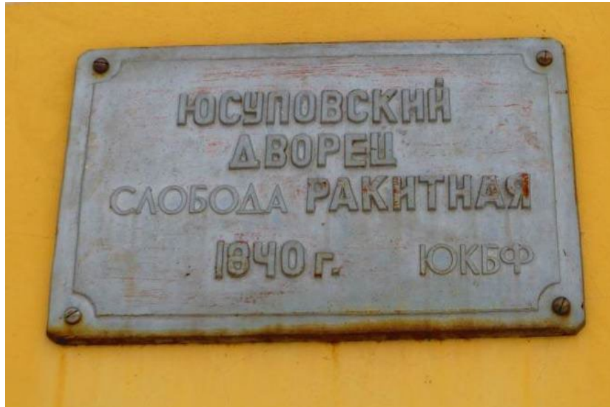
Фото таблички на дворцовом здании

Ответ демонстрируется с помощью фрагмента видео из документального фильма. При обсуждении, важно обратить внимание обучающихся, что исторически верной считается дата постройки или введения здания в эксплуатацию (начала использования здания в необходимых целях). Историками принято считать датой отсчета не закладку или даже видоизменения, а конечную дату завершения строительства.