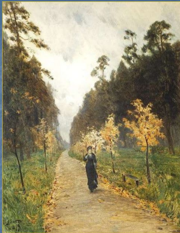
Осенний день. Сокольники (1879)