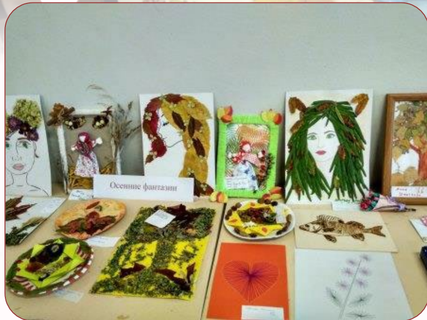
Работа с природным материалом